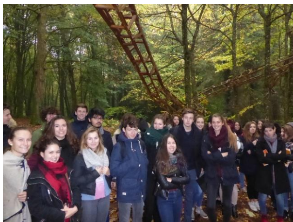
Découverte des œuvres du domaine de Kerguéhennec